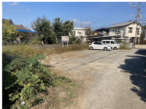
前面道路は42条2項道路。道路幅員は2m～2.5mの為、建物建築の際はセットバックを要します。