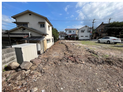
駐車場契約があるため、駐車場解約に2か月ほど期間を要します。