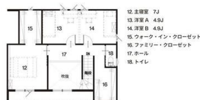
2st FLOOR PLAN